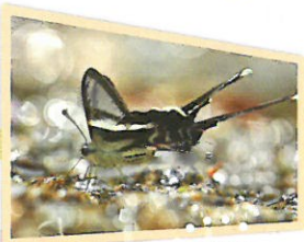
第十二屆 香港蝴蝶攝影比賽 2016 亞軍 陳慶忠先生