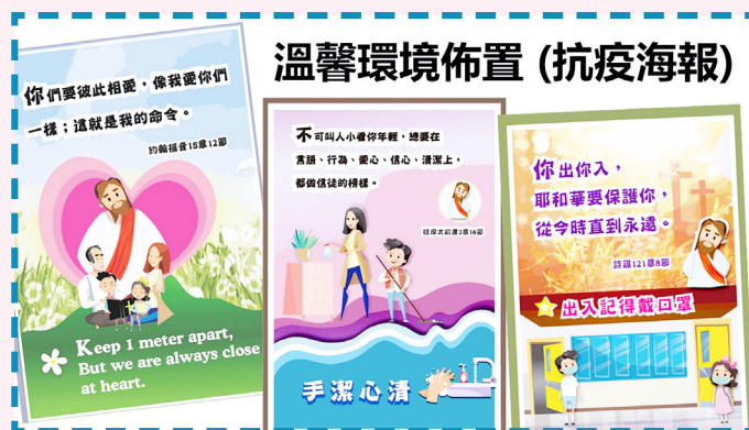
溫馨的小叮嚀，成為校園的溫馨佈置。