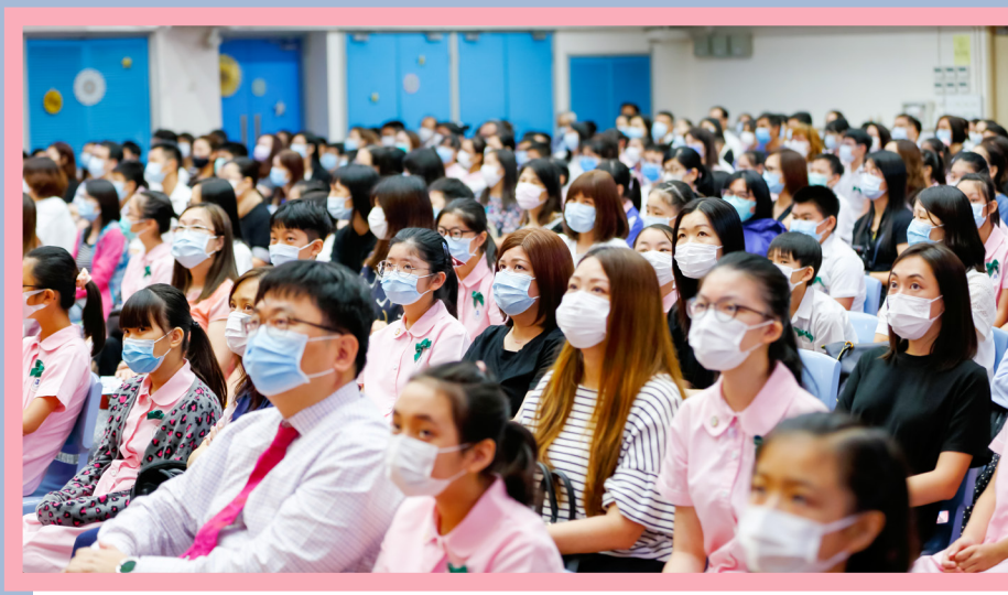
家長與子女並肩而坐。