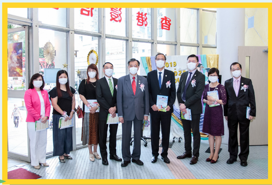
感謝嘉賓同來誌慶！