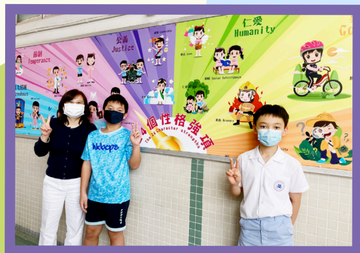
大家一起努力，成為「聯小達人」吧！