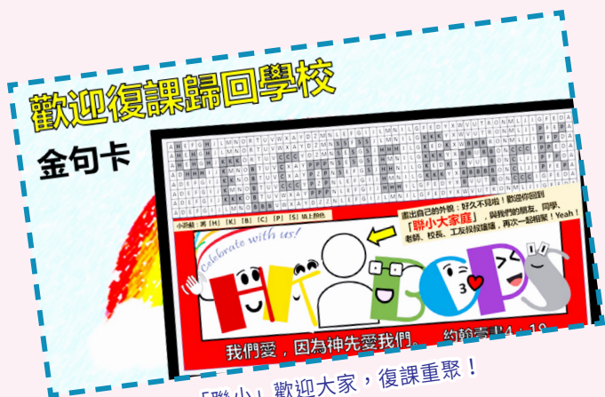
「聯小」歡迎大家，復課重聚！