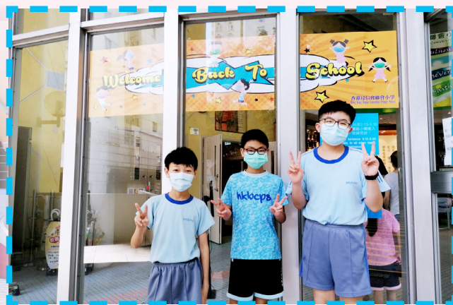
歡迎同學回來「聯小」大家庭！