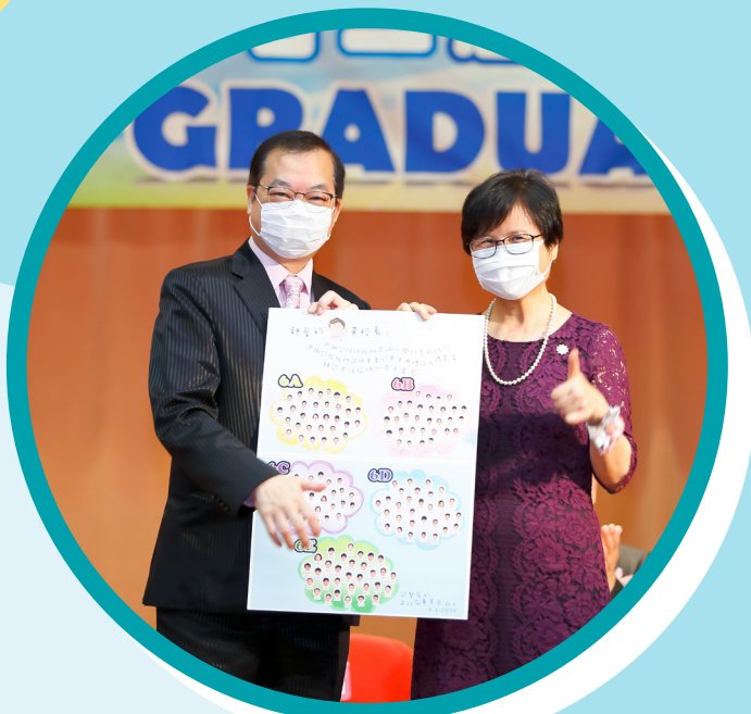
感謝黃校長的訓勉與鼓勵！