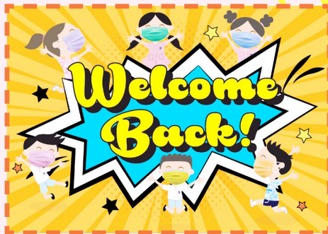
大門 welcome back