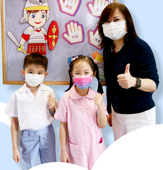
一年級的同学都能活出節制的生命。