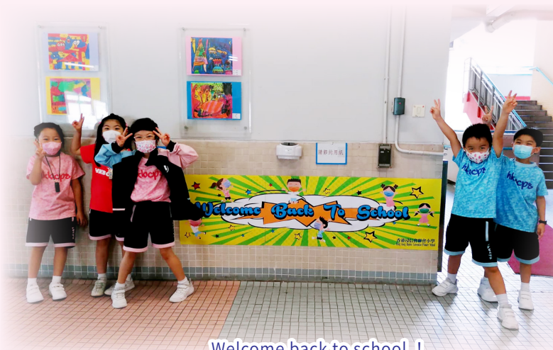
Welcome back to school !