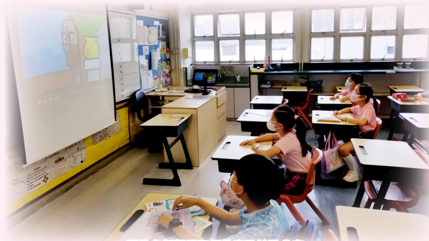
回校安靜觀看聖經故事及詩歌分享。