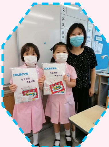
一上學便收到禮物呢！