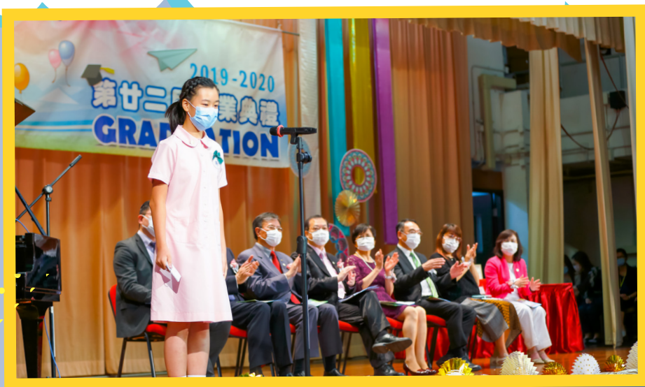
畢業生分享同學們的共同回憶——蒸水蛋，引發台下一片笑聲！

縱然畢業禮與以往不一樣，卻仍滿載着我們對畢業生的祝福：願各位畢業生們，在中學生涯中仍堅守「聯小精兵」的精神，正如你們社名「耀暉」所指——活出生命的亮光。