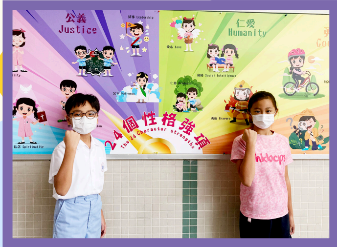
同學非常期盼本年度的生命教育主題活動！